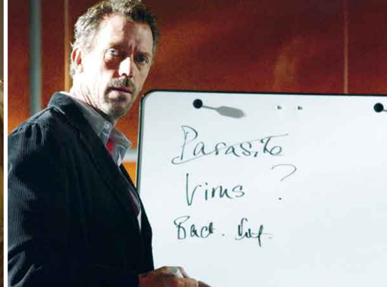
AUSSCHNITTE. Die Serienärzte Robert Chase und Eric Foreman überwachen die Babys während der Therapie mit einem Wirkstoff, der bislang nur im Labor getestet wurde (li.). Dr. House an der berühmten Tafel – während einer Differentialdiagnose werden alle zu den Symptomen passenden möglichen Ursachen gesammelt.

der Haut gekennzeichnet ist. „Viel leicht haben Antibiotika aber auch nichts damit zu tun“, mutmaßt House. „Ist Ihnen aufgefallen, wie niedrig der Blutdruck am Ende war, trotz der drei Vasopressoren?“ „Ein Herzschaden?“, vermutet Chase. „Wir werden sehen“, meint House und schickt sein Team nach Hause. Er selbst bleibt. Er hat noch etwas zu erledigen, von dem er sich Aufklärung verspricht. Er obduziert den Leichnam des Babys.